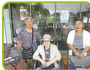
ちょっとひと休みでアイスをペロリ。おいしいね。