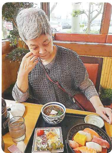
恥ずかしくて、食べられね

5～6月にかけて、苑外散歩を行いました。桜が満開に咲いており、皆さん嬉しそうに「きれいだな」と話されていました。