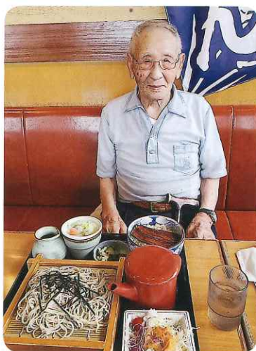
夏バテ防止にはやっぱりうなぎ