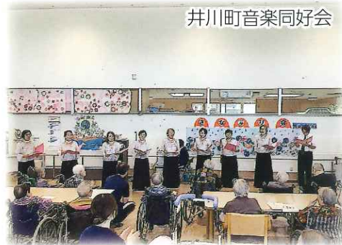
井川町音楽同好会