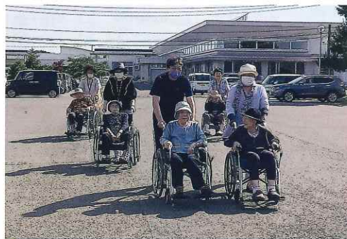
井川町民生委員協議会の方々に手伝っていただき、さくら苑の近くを散策しました。