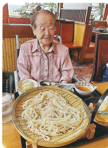
大きいな。おいしそう