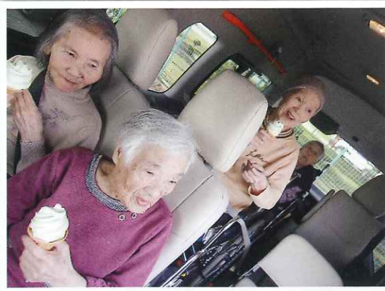
さくらの車窓から