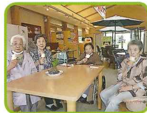
(天王グリーンランド)