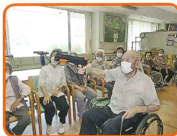
ハートを狙い撃ち？