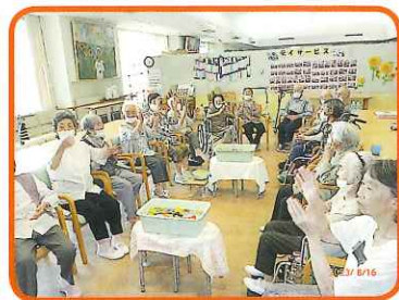
チーム対抗でドキドキ♡