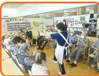
太鼓のおはやしにのって