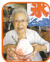
今年の夏はこれが一番