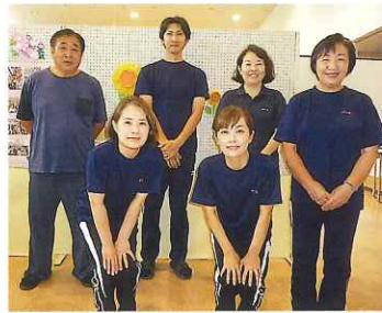
デিসタッフ 美男美女で頑張ります

デイサービスは同世代の方たちの交流の場です。皆さん、デイに来ると気持ちも引き締まり、雑談に花を咲かせ、沢山笑って過ごされます。「ここに来ると楽しい。」と言う声を聞くと、私たち職員もやる気満々、パワー全開です。これからも、とびっきりの笑顔になって楽しんで頂けるよう職員一同努めて参ります。