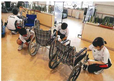
義務教育学校の9年生が、車椅子などを綺麗に掃除してくれました。