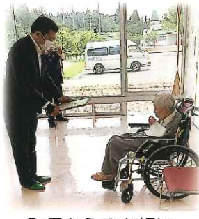
町長からのお祝い