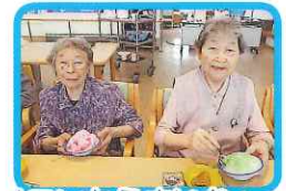
メロンもうまいなあ～