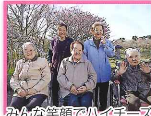
みんな笑顔でハイチーズ