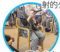
真ん中をねらって!