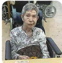
昔、子供に聞かせたな～