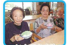
いちごかき氷 おいしいなあ