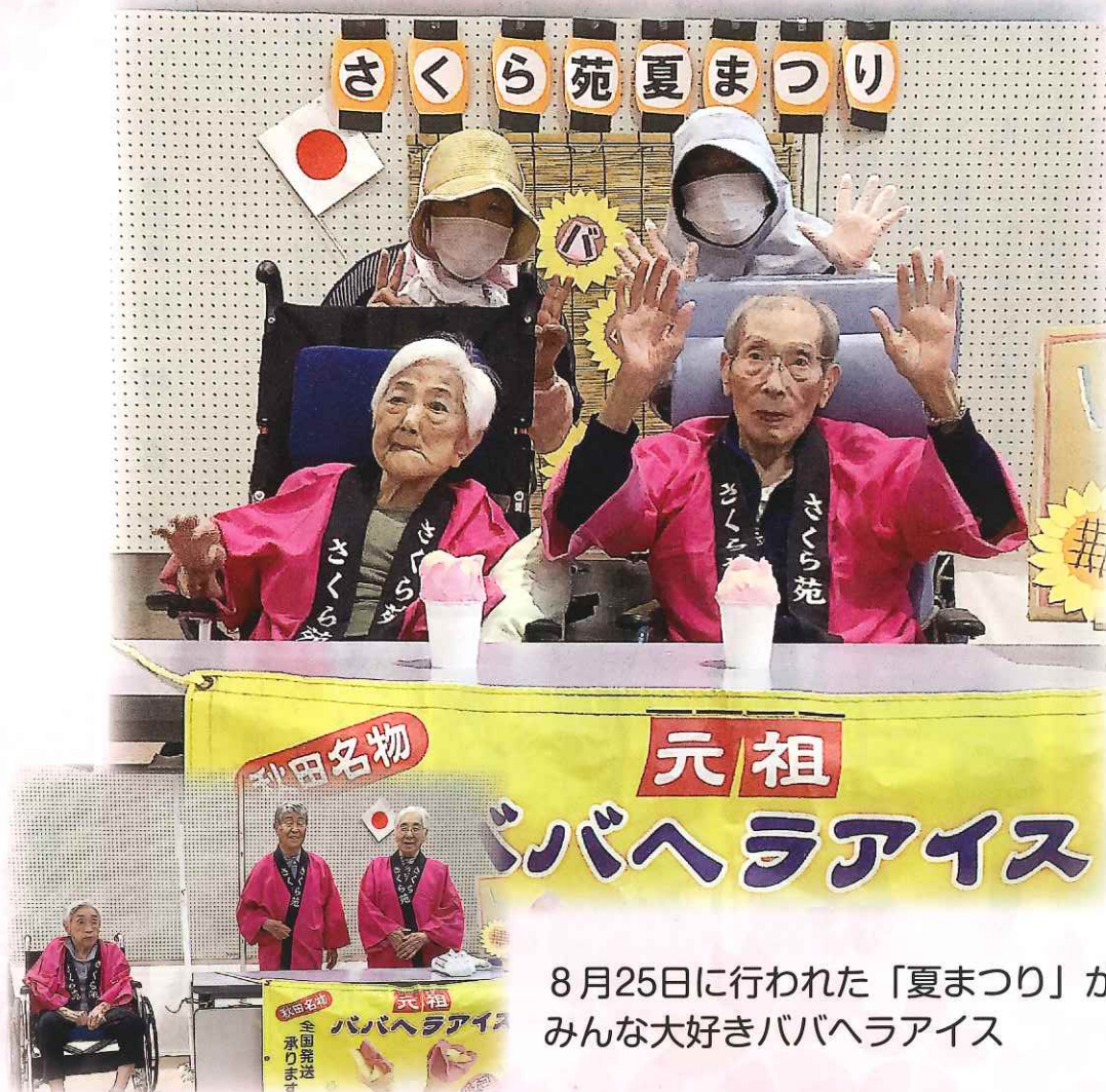
8月25日に行われた「夏まつり」から みんな大好きババヘラアイス