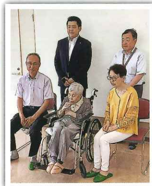
ご家族の皆さんで

また、施設職員で卒寿祝いを行い、メッセージカードや花束のプレゼントをしております。