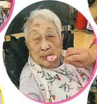
久しぶりに食べた